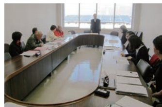
大木ささえ隊作戦委員