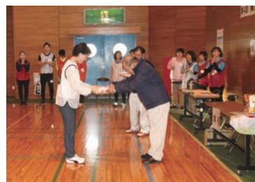
ビンゴだ！ボールゲームで高得者に個人賞が授与されました