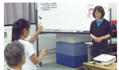
習った手話を実際に表現しました