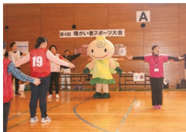
準備体操は、「大木かたらんね体操」を行いました

今年で4回目を迎えた障がい者スポーツ大会は、参加者の皆さんにも定着してきているようです。障がい者スポーツにも様々な競技があることを多くの方に知っていただくために、競技種目は毎年少しずつ変えていますが、ふうせんバレーボールは初年度から続けてきました。その成果は着実に皆さんの身につけて、試合ではラリーが続き、とてもいいゲームが行われていました。