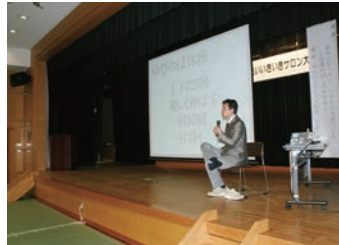
「講演」ゆびのば体操