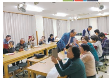
スマートフォンで動画撮影の様子