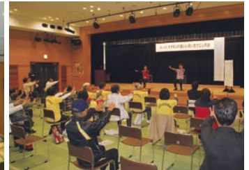
大木かたらんね体操