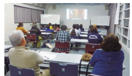
聴覚障がい者の生活について学びました