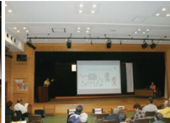
全地区サロンの紹介