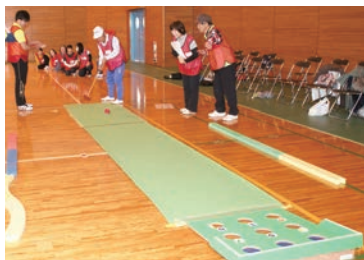
ビンゴだ！ボールゲームは、たいへん難しかったようです