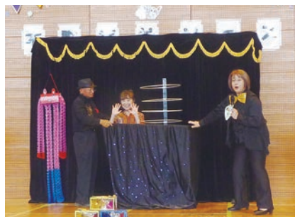
手品ショーで楽しい時間を