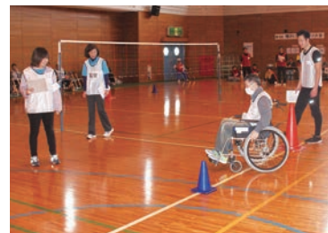
スラロームは、コーンに当たらないよう車いすを操ります