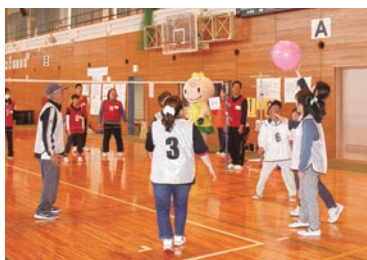
ふうせんバレーボールは、上手なラリーが続きました