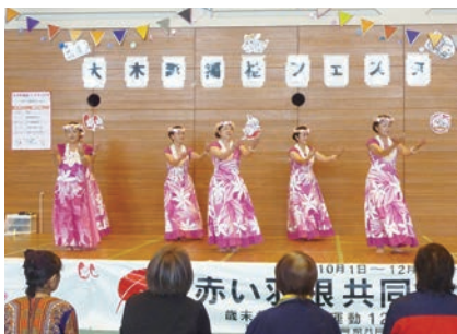
フラダンスで癒されて

今年の福祉フェスタは、内容をより盛り上げるために、アリーナ内にステージを作り、ステージの上でもイベントを行いました！参加団体や事業所の紹介、手品の披露、フラダンスなど、参加していただいた方々に大変盛り上げていただき、ご来場された皆さんは楽しい時間を過ごされていました。