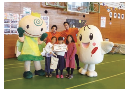
くるっち、希望くんと一緒に