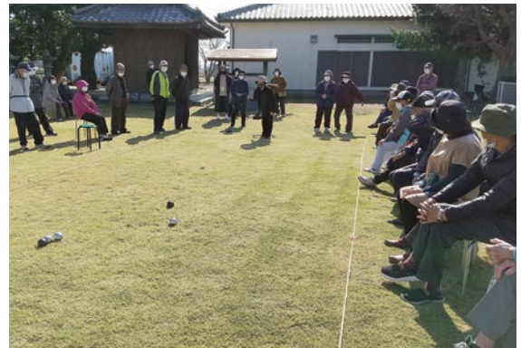
上牟田口サロン（11/17）ペタンク大会

木佐木校区では、「いきいきサロン」の重要性を校区全体で共有し、推進してきました。「いきいきサロン」は①仲間づくり ②孤立・閉じこもりの防止 ③見守り・安否確認 ④やりがい・生きがいづくり ⑤元気なときから健康づくり ⑥暮らしに役立つ情報交換 ⑦世代間交流など様々な効果があり、地域の拠点になります。令和元年時点では16行政区中6行政区だった「いきいきサロン」は、令和3年には13行政区で行われるようになりました。