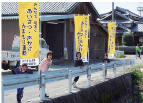
元気で明るい地域 人とのつながり・防犯効果

大莞校区では令和元年に全戸配布のアンケート調査を行い、まず「あいさつ・声かけ・見守り」運動をしてお互いに支えあう必要があるという課題に、のぼり旗の設置やチラシを配布し住民の意識を高めることにしました。また高齢者の方が買い物などに出かけるための移動手段に困っている課題に対しては、調査で必要性が高かった吉祥区をモデル事業として令和3年6月から「移動支援」を開始しています。現在は送迎ボランティアにより週1回移動支援を行っています。今後は、対象地区を拡大して利用者を増やしていく予定です。誰もがいつまでも住み慣れた大莞校区で生活できるように地域全体で支えあう活動を行っています。