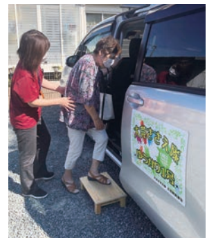
自宅に迎えに行きアスタロピスタで買い物の後、自宅へ送ります。 利用者同士、顔を合わせお話しするのも楽しみにされています。