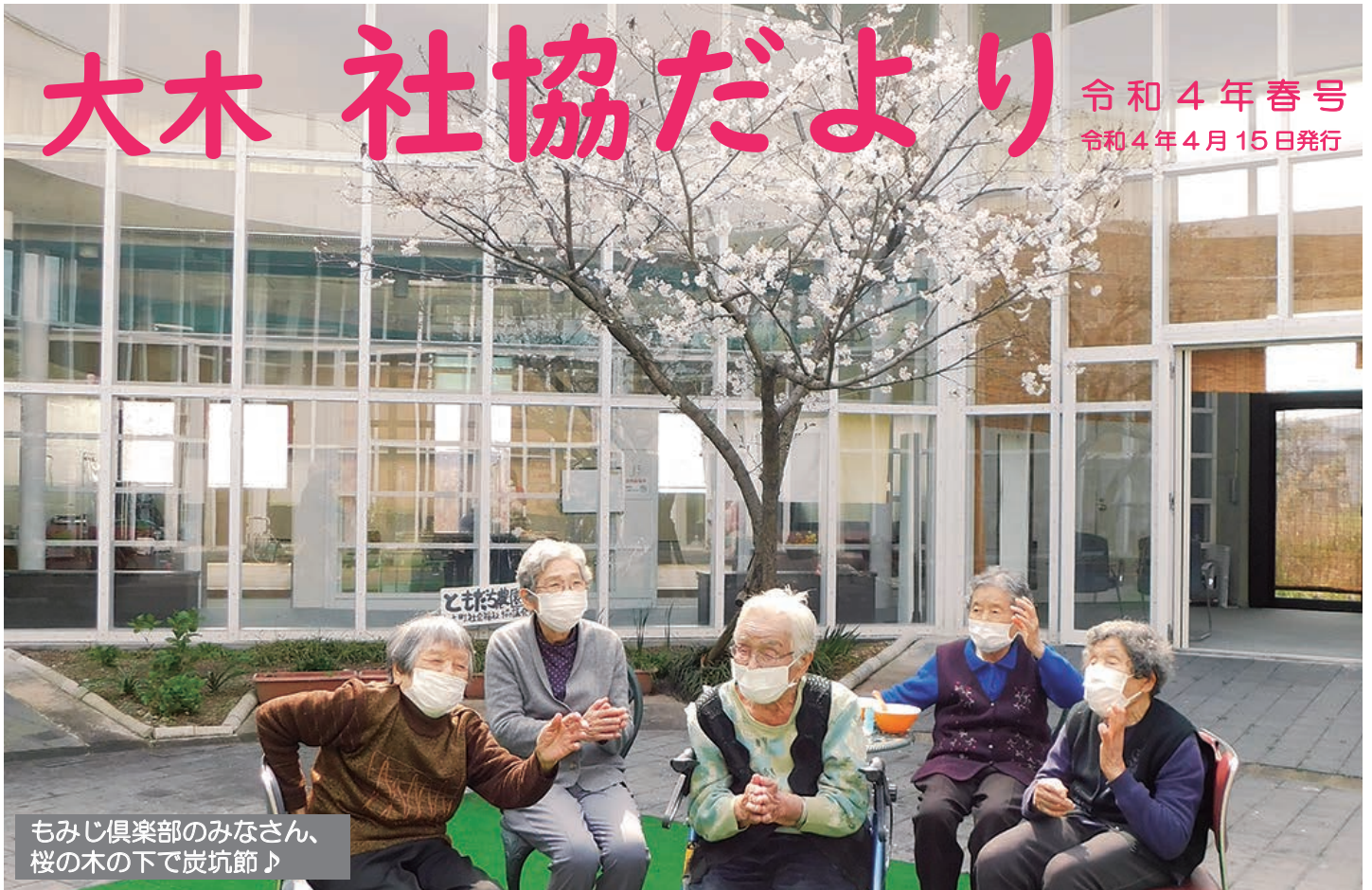
もみじ倶楽部のみなさん、 桜の木の下で炭坑節♪