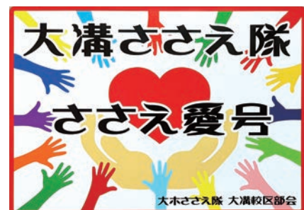
ボランティアさんが販売する移動販売車の目印（ステッカー）