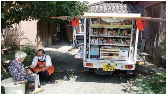
移動販売車「とくし丸」の買物風景

木佐木校区では、令和3年3月より移動販売車「とくし丸」の販売が開始されました。現在は校区南西部を中心に17ヶ所で販売されています。「とくし丸」はなんと毎回300品近い品揃え！！また、自宅周辺での販売のため、ご近所の方とのよい交流の場ともなっています。足の不自由な高齢者の方々などに、とても喜ばれています。