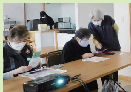
R3年度スマートフォン教室の様子