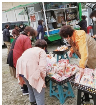
地域住民と買い物支援活動ボランティアとの交流