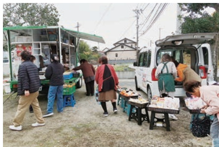
販売日に合わせてサロン・老人クラブ活動を開催されています。（道本・堀田地区）

大溝校区では、高齢者が買い物に行くことができないという課題が挙がり、この課題解決に協議を重ね、令和2年10月30日よりグリーンコープ生活協同組合による移動販売を開始しました。当初は4地区（十間橋・横溝本村・上白垣・五反田）でしたが、現在は6地区（道本・堀田が追加）で販売しています。また、品物の充実を図るために、フードショップ石川さんの商品を大木町ボランティアのみなさんが販売しています。自ら買い物ができることを喜ばれ、また地域住民の皆さんのふれあいの場にもなっています。